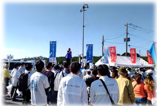
大洗町大洗サンビーチ