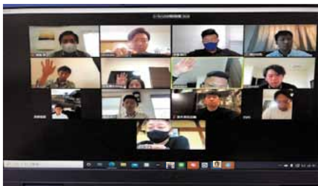
写真: 第5回リモート幹事会より

直接会えないながらも、リモートで会話をする ことで、コミュニケーションを図っています。